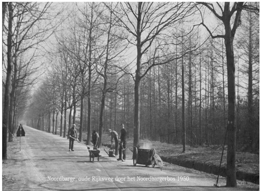
Noordbarge, oude Rijksweg door het Noordbargerbos 1950

Bij de verbreding van de Ermerweg en de parallelwegen op Urk in de jaren vijftig werden deze bomen jammer genoeg gekapt. Ook over de bewoners langs dit deel van de Ermerweg valt veel te vertellen. Waarom is bv. de eerste boerderij van Lammert Mennik aan de vroegere Heirweg en niet aan de latere Ermerweg gebouwd. Dat doen we uit de doeken. Wie kent niet de beetje mensenschuwe broers Stegen in hun huisje in het bosje naast de huidige NAM-locatie. Maar ook het boswachtershuis, waar de grootvader van Arjen Robben heeft gewoond, wordt niet vergeten.