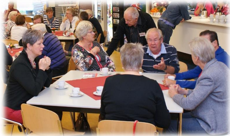
Inloopdag 2014

2014 loopt op zijn laatste benen. Dit jaar is weer veel werk in het boek gestoken. Wat hebben er veel families in Noordbarga gewoond. Gelukkig, het tempo is hervonden. De werkgroep van School III schiet ook aardig op. We weten op welke plaatsen en in welke gebouwen de openbare lagere scholen stonden. Ook weten we dat de hoofden van deze school goede meesters en sterke persoonlijkheden waren. Bijna zonder uitzondering hebben ze allemaal vele jaren achtereen voor de klas gestaan. Het tegenwoordig gevraagde management deden ze er meestal gewoon bij. Binnenkort kan dit hoofdstuk worden afgesloten.